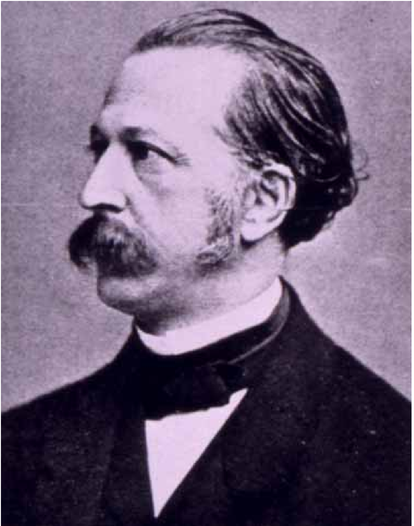
Fontane um 1878. Er hat ein Faible für den Norden. Nordische Namen und Themen spielen bereits in den Gedichten und im Roman-Debüt „Vor dem Sturm“ eine wichtige Rolle. Und in „Effi Briest“ ist Kantor Jahnke ein auf „Hansa, Skandinavien und Fritz Reuter eingeschworener“ Mann, während Leslie Gordon in „Cécile“ von Lübeck, Wismar und Stralsund schwärmt, weil er die „Hansa-Passion“ hat.