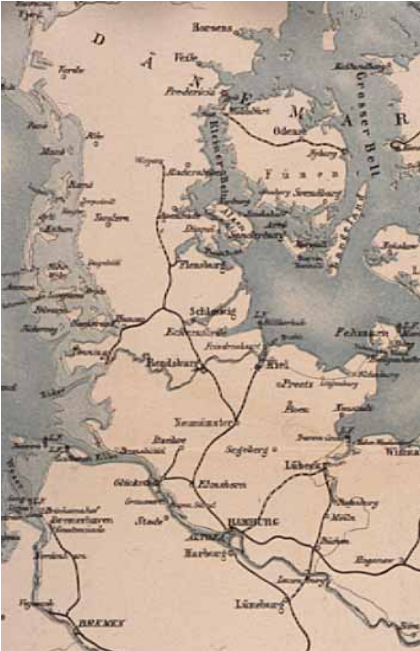
Schleswig-Holstein um 1864 aus der Sicht des preussischen Generalstabs. Besonderer Wert wird auf das noch wenig ausgebaute Eisenbahnnetz gelegt. Fontane reist Mai 1864 von Altona nach Kiel, und zwar mit der 1843 eröffneten Ostsee-Eisenbahn. Um nach Schleswig und Flensburg zu gelangen, geht es zurück nach Neumünster. Auf seiner zweiten Reise im September kann der „Wanderer“ noch nicht die Trasse Hamburg-Lübeck benutzen, die erst 1865 fertiggestellt wird. Von Berlin fährt er über Büchen in die Travestadt, wo er sich nach Kopenhagen einschiffet. Die Rückreise verläuft über Flensburg und Husum.

Im Norden Mittel-Europa's, wo die Elbe das Meer erreicht, streckt das deutsche Festland, als erhöb' es seinen Arm gen Norden, einen Halbinsel-Damm in das Meer hinaus; dieser Damm heißt die cimbrische Halbinsel. Er theilt die Wassermasse, welche die deutschen Küsten bespült, in zwei Hälften, in eine Ost- und eine Westsee, gemeinhin Nordsee geheißen. Der Damm trennt zwar die Meere, aber zugleich ist er die Brücke zwischen Deutschland und Skandinavien. Seine südliche Hälfte ist Schleswig-Holstein.