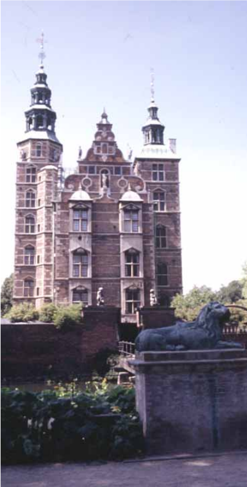
Das unter Christian IV. entstandene Schloß Rosenborg. Es „macht einen Eindruck, als wohne das ‘Märchen’ selber darin, und als seien die gemalten Scheiben, die hie und da mit wirklichen Scheiben abwechseln, just die Stellen, wo die Prinzessin Goldhaar dann und wann die heimlichen Fenster öffnet und auf die spielenden Kinder niederblickt.“

Nun ja, möchte man aus heutiger Sicht anfügen, das ist ein zu weites Feld. Und hätte unser Journalist das Gegenteil behauptet, es wäre mit Sicherheit hilfreicher gewesen.