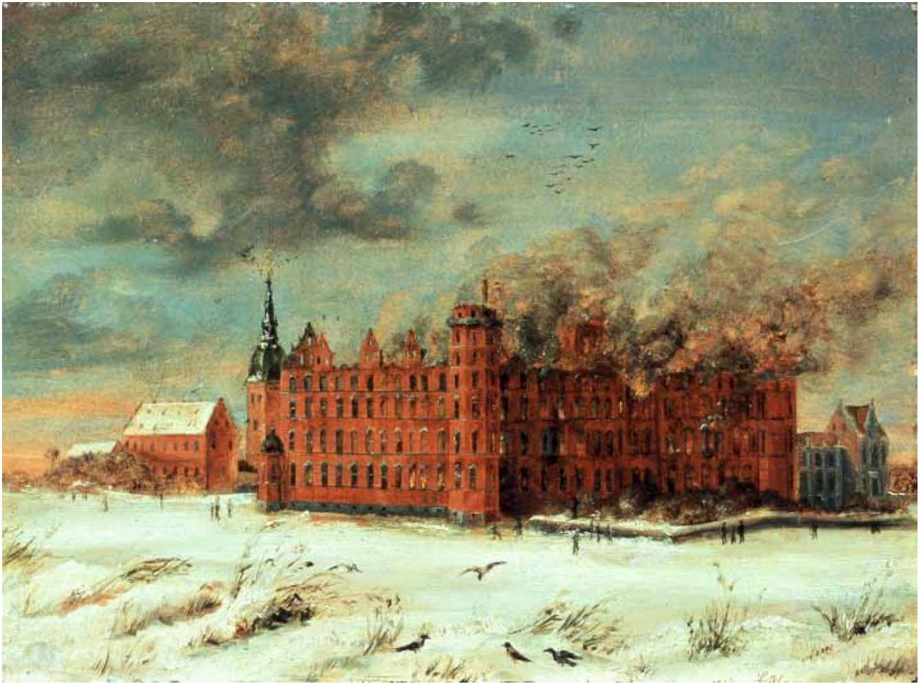
In seinen Roman-Recherchen greift Fontane auf eine Zeitungsmeldung vom 18. Dezember 1859 zurück: „Schloß Frederiksborg, das schönste Bauwerk Christians IV. u. Residenz Frederiks VII., ist in der Nacht vom 17. zum 18. total niedergebrannt“ – in „Unwiederbringlich“ allegorisiert dieser Brand den dramatischen Wendepunkt: Holks Herz steht in Flammen, und Ebba brennt „der Boden unter den Füßen.“

Halber“, fügt sie hinzu, was Holk in den Ohren klingen muß, denn kurz zuvor hat Christine ihm unmißverständlich zu verstehen gegeben: „Ich bin nicht für halbe Verhältnisse.“ 23