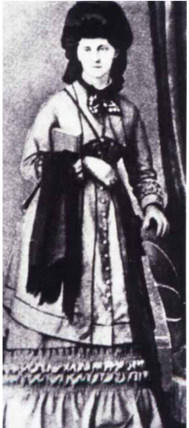
Emilie Fontane Anfang der 50er Jahre. Fontane trifft seine Jugendfreundin 1844 in Berlin wieder. Ein Jahr später ist Verlobung, doch erst 1850 erfolgt die Einfahrt in den Hafen der Ehe, in dem es oft sehr stürmisch zugehen wird.

Zunächst sind es nur persönliche Gründe, die den jungen Berliner Dichter drängen, sein Glück in der Neuen Welt zu suchen.