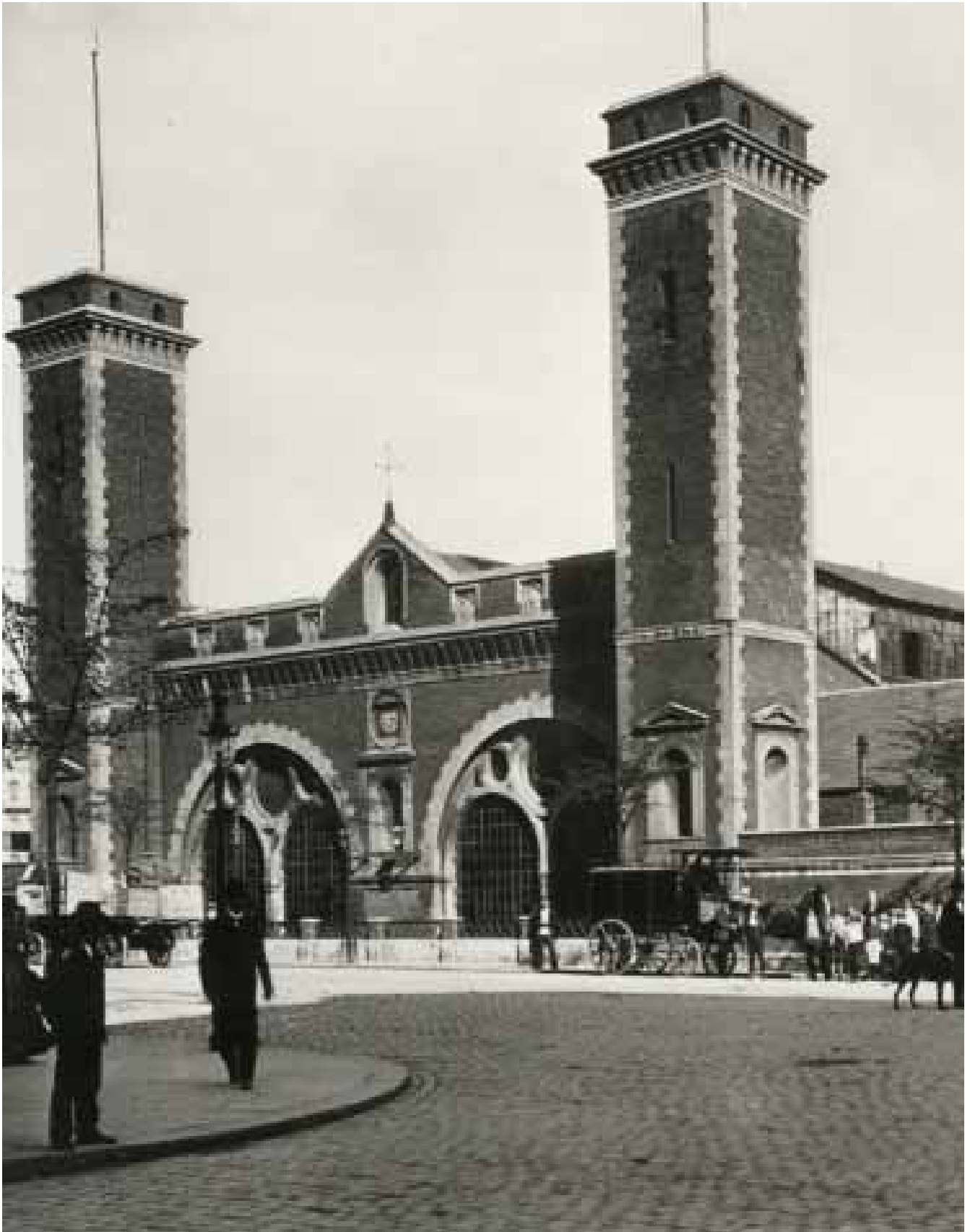
Der Berliner Bahnhof in Hamburg, bis 1903 der westliche Endpunkt der 1846 eröffneten Hamburg-Berliner-Eisenbahn. Kommt Fontane an die Elbe, ist die Reise hier (Nähe Kloostertor) vorläufig zu Ende. Zur Weiterreise nach Schleswig-Holstein hat er sich ins holsteinische und bis 1864 dänische Altona zu begeben, was ab 1866 auch mit der Verbindungsbahn Altona-Sternschanze-Dammtor-Kloostertor möglich ist.